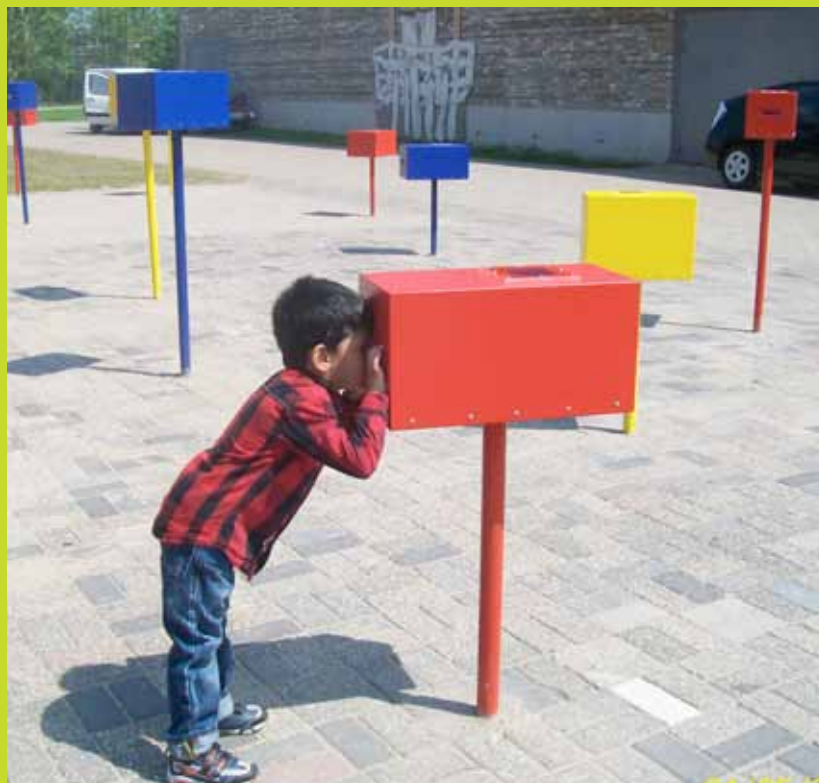
Bezoeker 'Mijn kunst op straat'