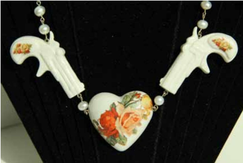
Gevel CBK Zuidoost met voorbijganger Lammers & Lammers, 'Guns and Roses'; artikel uit de CBKadoshop