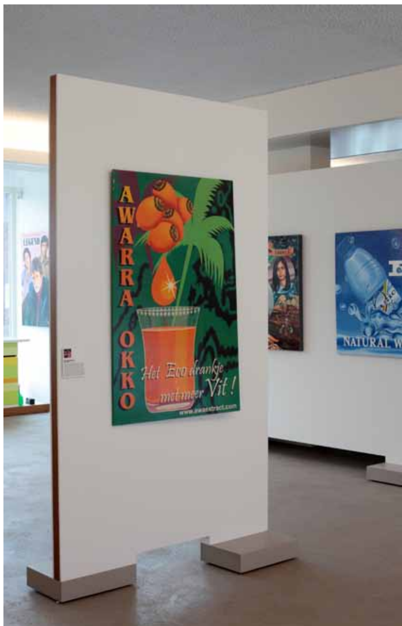
46 Tentoonstelling 'Schaafjys en Wilde bussen: Straatkunst in Suriname'