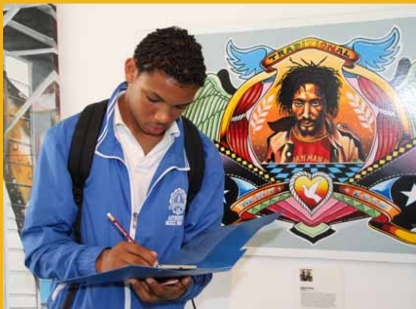
Leerlingen IMC Weekendschool bij monument Anton de Kom Scholier tijdens bezoek bij 'Schaafijs en Wilde bussen'