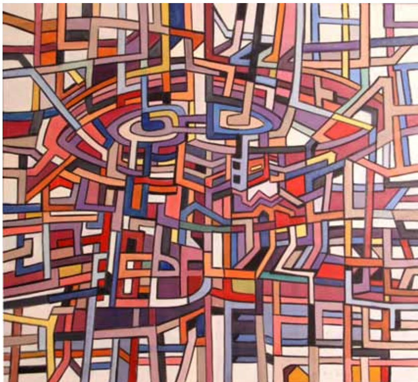
d'Ntara, 'zonder titel'; aankoop kunstuitleen