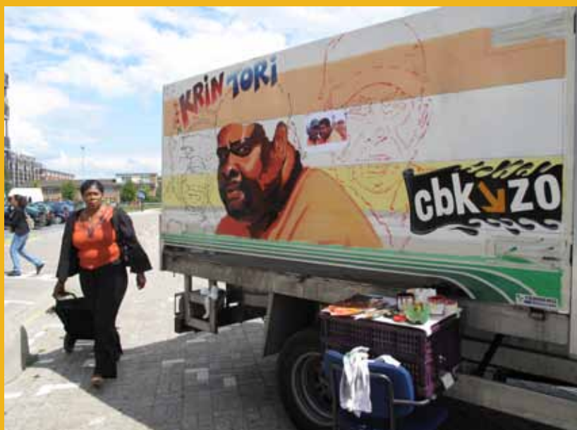
Deelnemer 'Straat van Sculpturen Junior' bij haar werk Veegwagen wordt beschilderd tijdens 'Schaafijs en Wilde bussen'