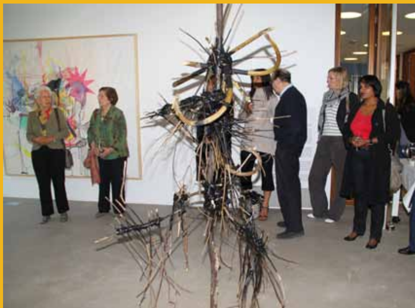
Bezoekers op openingen