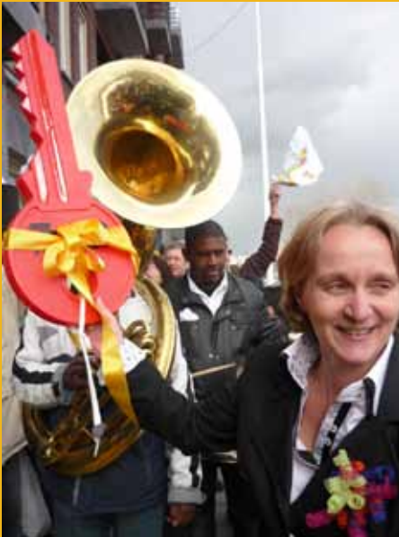
Feestelijkheden bij de opening van de nieuwbouw van CBK Zuidoost aan het Anton de Komplein